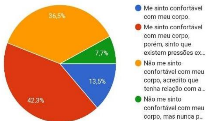
GRÁFICO 2: PERCEPÇÕES DAS RESPONDENTES SOBRE GÊNERO E CORPO.

E é aqui que se pode inserir o termo corpo político citado anteriormente: seu corpo identitário é tido como um manequim, passível de manipulações e interferências