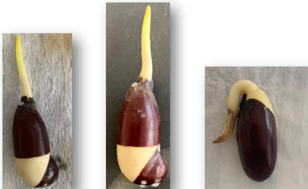
Figura 1. Sementes de baru com emissão do hipocótilo.

Primeira contagem de germinação (PC): Realizado em conjunto com o teste de germinação, sendo o registro da porcentagem de plântulas normais verificado aos 7 dias após a instalação do teste. As sementes foram consideradas germinadas quando apresentaram emissão do hipocótilo (Figura 1).